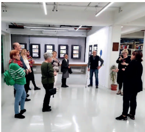
Slika 9. Proslava 10. rođendana Čitateljskog kluba „Knjiški moljac“ u Gradskoj knjižnici „Ivan Goran Kovačić“ u Karlovcu

Posjet je iskorišten za zajednički susret s članicama Čitateljskog kluba Cheeta(j)! te razmjenu čitateljskih iskustva u atraktivnom kafiću „Kava i knjiga“. Slavlje je privedeno kraju u Gradskom kazalištu Zorin dom gledanjem humoristične hit predstave Pračovjek koja na duhovit način govori o (pra)povijesti muško-ženskih odnosa, a koju je režirao i u njoj glumi Karlovčanin Peđa Gvozdić.