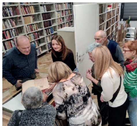
Slika 10. Proslava 10. rođendana Čitateljskog kluba „Knjiški moljac“ u Gradskoj knjižnici „Ivan Goran Kovačić“ u Karlovcu i susret s članovima Čitateljskog kluba Cheeta(j)!