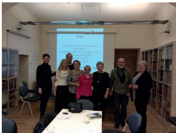
Slika 7. Proslava 5. godišnjice djelovanja Čitateljskog kluba „Knjiški moljac“ 6. studenog 2018.

Članovi Čitateljskog kluba „Knjiški moljac“ sastali su se krajem siječnja 2020. u maloj dvorani Knjižnice raspravljajući o knjizi blagdanske tematike pod naslovom Klub božićnih kolačića . Uz razgovor o pročitanoj romanu svatko je izradio straničnik koji će mu poslužiti za čitanje knjiga. Pozornost je posvećena i kratkim pričama iz zbirke priča Pričaj mi priču hrvatskih psihologinja Majde Rijavec i Dubravke Miljković.