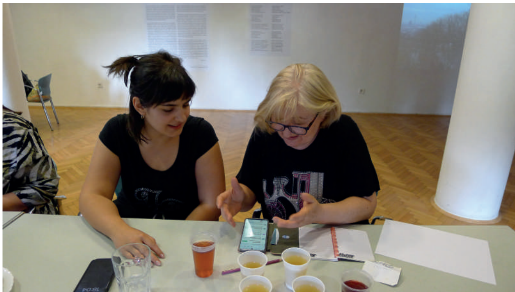
Slika 4. Međugeneracijska suradnja i učenje u Čitaonici i Galeriji VN

Sudionici programa ispunili su anketni upitnik formuliran po ljestvici Likertova tipa u kojem su iskazivali stupanj slaganja s navedenim izjavama na skali od jedan do pet. Unutar obaveznih odgovora postavljena su pitanja o iskazivanju stupnja zadovoljstva učenjem, novim poznanstvima i samim prostorom.