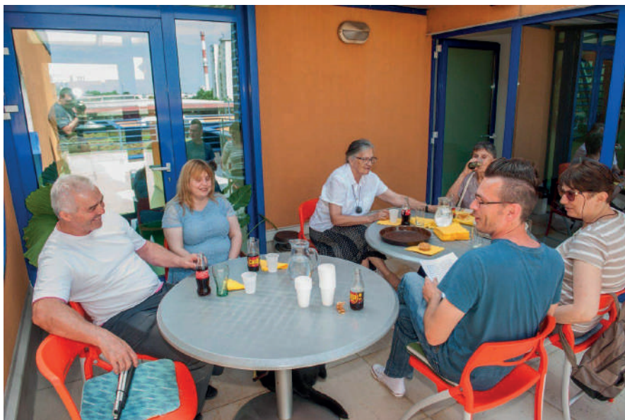
Slika 2. Jedan od čitateljskih susreta

U godinu dana, na 12 susreta, članovi su pročitali isto toliko knjiga, a neki od naslova i autora su: Osmi povjerenik Renata Baretića, Umijeće utrkivanja po kiši Gartha Steina, Posrednik Johna Grishama, Čovjek koji je skakao u srce požara Nicholasa Evansa, Čudo u Poskokovoj Dragi Ante Tomića i dr.