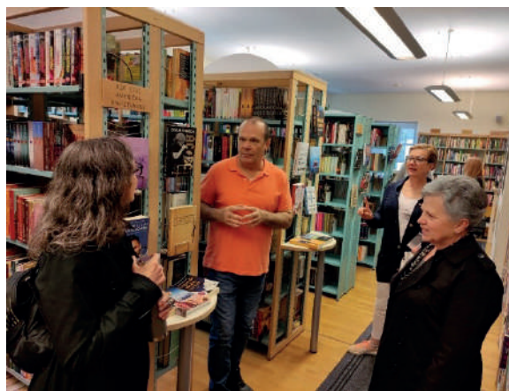
Slika 4. Susret s članovima Čitateljskog kluba Cheeta(j)! iz Gradske knjižnice „Ivan Goran Kovačić“ iz Karlovca