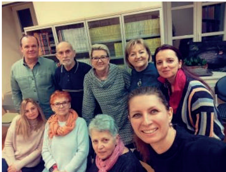
Slika 1. Susret članova Čitateljskog kluba „Knjiški moljac“ 23. siječnja 2024. uz razgovor o romanu Ruska zima

Prvi ovogodišnji susret članova Čitateljskog kluba „Knjiški moljac“ održan je 23. siječnja 2024. Kao polazište za raspravu poslužio je izvrstan autobiografski roman Ruska zima autora Briana Grovera i Jima Rickardsa utemeljen na istinitoj ljubavnoj priči o Brianu Groveru i Ileani Petrovoj, objavljen u izdanju Mozaik knjige 2010.