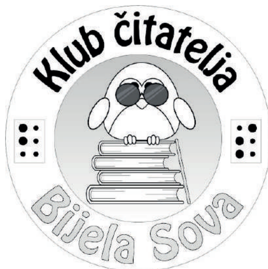
Slika 1. Logo Čitateljskog kluba za slijepo i slabovidne osobe „Bijela sova“ Karlovac

Karlovačka knjižnica još je 2003. godine, prva u Hrvatskoj, nabavila računalo s govornom jedinicom Jaws za Knjižnicu za mlade koji i slijepim osobama omogućava pretraživanje izvora informacija na internetu. Tada je bila prva narodna knjižnica u Hrvatskoj koja je nudila tu vrstu usluge za slijepo i slabovidne korisnike. Povodom svjetskog dana Brailleovog pisma, 4. siječnja 2012. godine, knjižnica je na Odjelu audiovizualne građe otvorila Kktak za slijepo i slabovidne osobe koji je opremljen računalnom opremom i elektroničkim pomagalicama. Za kutak je Knjižnica nabavila uređaj Poet Compact i čitač ekrana SuperNova .