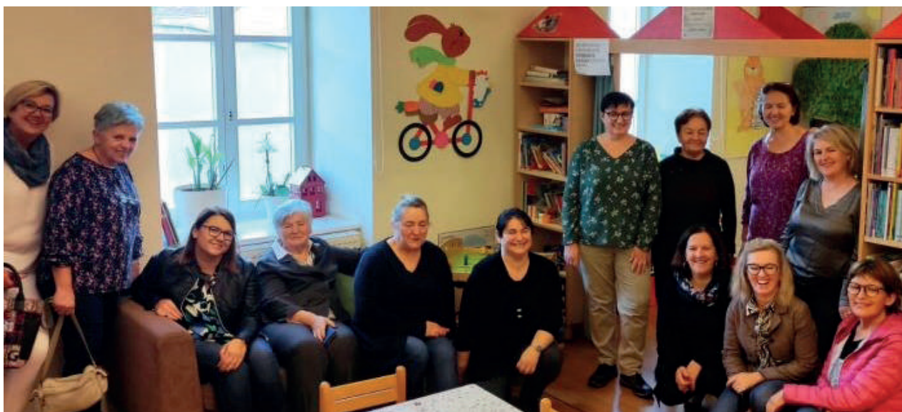
Slika 5. Susret s članovima Čitateljskog kluba Kulturno-umjetničkog društva „Sveti Juraj na Bregu“ iz Međimurja

U okviru nacionalne manifestacije Mjesec hrvatske knjige čitateljski klub posjetile su 16. listopada 2023. članice Čitateljskog kluba koji punih pet godina djeluje u okviru Kulturno-umjetničkog društva „Sveti Juraj na Bregu“ iz Međimurja. Nakon razgledavanja prostorija knjižnice održan je sastanak te rasprava o romanu Doživotna robija Vedrane Rudan koji je svojom tematikom o majčinstvu kao doživotnoj robiji otvorio brojna pitanja. Članovi Čitateljskog kluba „Knjiški moljac“ rado su razmijenili stečena čitateljska iskustva o brojnim knjigama koje su tijekom svog desetogodišnjeg djelovanja pročitali te prihvatili i brojne zanimljive prijedloge za nadolazeće zajedničke susrete.