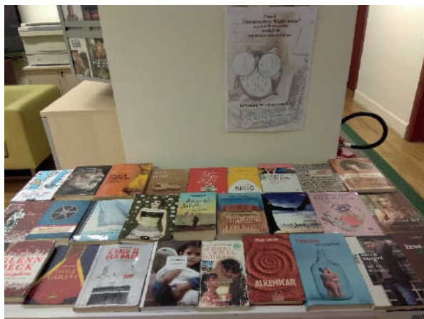
Slika 8. Izložba pročitanih knjiga u petogodišnjem djelovanju Čitateljskog kluba „Knjiški moljac“

Članovi Čitateljskog kluba „Knjiški moljac“ proslavili su petu godišnjicu djelovanja u utorak 6. studenog 2018. u maloj dvorani Knjižnice prisjetivši se četrdesetak naslova pročitanih knjiga i mnogobrojnih zajedničkih susreta te prisustvovanja promocijama knjiga hrvatskih autora. Iz mnoštva pročitanih knjiga izdvojili su najzanimljivije naslove domaćih i stranih autora: Tihi zov Australije , Malo drvo , Susjed , Danci i stranci , I na početku i na kraju bijaše kava , Brdo , Popis mojih želja , Stoner , Osmi povjerenik , Primavera i Susjed .