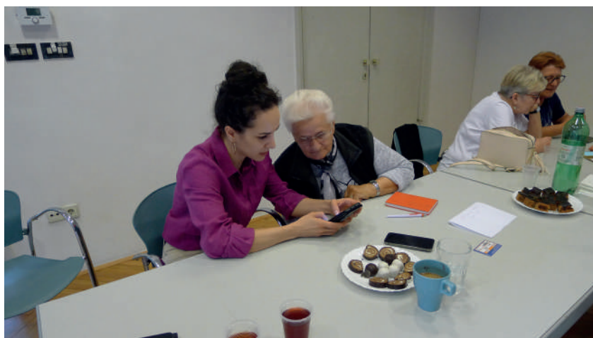
Slika 3. Mladi podučavaju umirovljenike korištenju aplikacija na mobitelima

U sklopu projekta 65 plus , u travnju 2024. godine, pokrenut je novi program Čaj i aplikacije: međugeneracijsko učenje koji vode djelatnici Čitaonice i Galerije VN. 13 Mlade volonterke i volonteri podučavaju umirovljenike učinkovitoj upotrebi aplikacija na mobitelima dok umirovljenici dijele svoja dugogodišnja prikupljena znanja i spoznaje. U metodologiji procjene uspješnosti započinjanja novog projekta, nakon uspješnog pilot programa međugeneracijske suradnje, korišten je anketni upitnik na namjernom uzorku ispitanika.