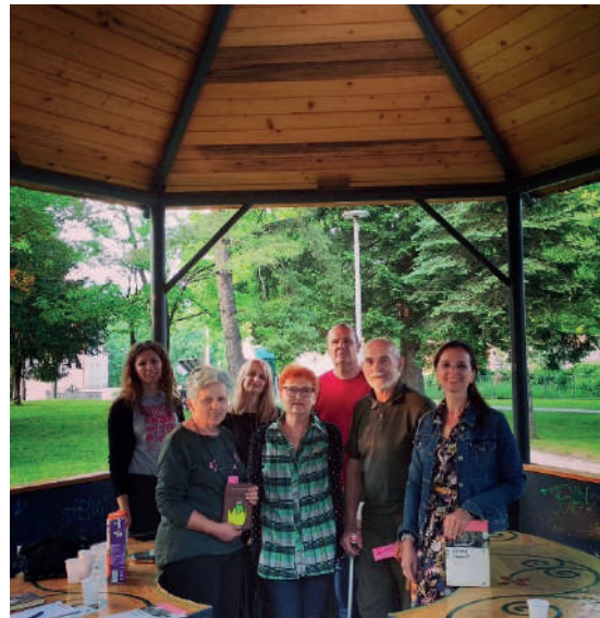
Slika 2. Čitateljski sastanak u Đulinu vrtu te razgovor o romanu „Žena s drugog kata“ Jurice Pavičića (svibanj 2023.)