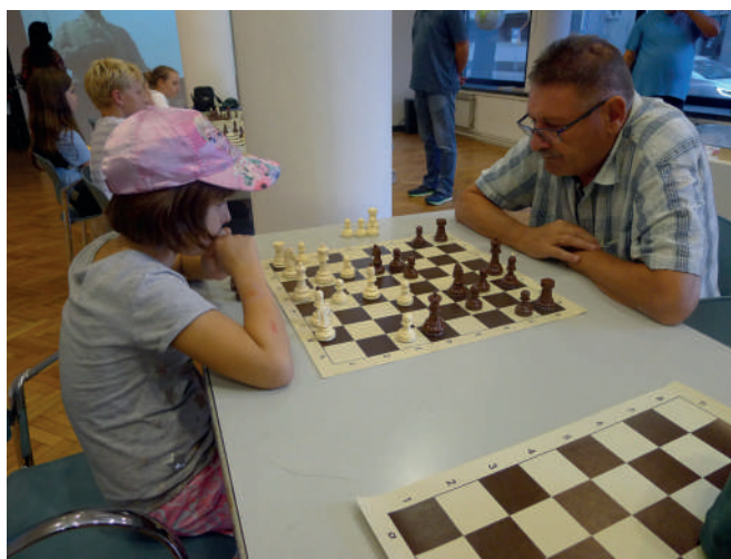
Slika 1. Djeca i umirovljenici igraju šah u projektu Ti si na potezu

Osmišljen kao odgovor na problem usamljenosti starijih osoba i potrebu za povećanjem njihove digitalne pismenosti, projekt Ti si na potezu: šah i aplikacije proveden je u Čitaonici Galeriji VN kao pilot projekt tijekom rujna i listopada 2023. godine. 12 Ova inicijativa donijela je svjež pristup povezivanju generacija kroz razmjenu znanja i vještina. U okviru projekta, umirovljenici su prenosili svoje iskustvo i znanje o šahu na osnovnoškolce iz viših razreda, dok su djeca, zauzvrat, podučavala umirovljenike osnovama korištenja raznih aplikacija na mobilnim telefonima. Djeca su ozbiljno pristupila svojoj ulozi „učitelja“, shvaćajući odgovornost koju nosi prenošenje znanja i iz projekta izašla osnažena novim samopouzdanjem.