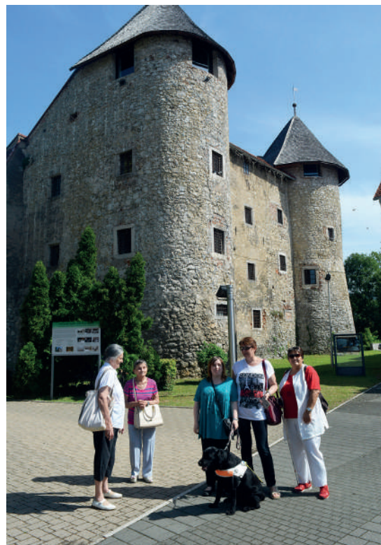
Slika 4. U posjetu Ogulinu

Kao posebno zanimljiv posjet, svakako treba izdvojiti i gostovanje u Hrvatskoj knjižnici za slijepo osobe koja omogućava pristupačnost knjižnične građe i informacija korisnicima s teškoćama pri čitanju standardnog tiska prema njihovim potrebama i zahtjevima. Budući da sama proizvodi fond, u njezinom se sastavu nalaze studiji za snimanje zvučnih knjiga i brajčna tiskara. 5