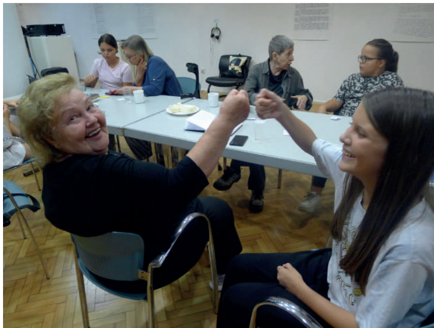
Slika 2. Najava za program „Čaj i aplikacije: međugeneracijsko učenje“

Rezultati programa Ti si na potezu: šah i aplikacije , pokazali su potrebu umirovljenika za nastavkom programa podučavanja digitalnim tehnologijama. Istraživanjem individualnih potreba i specifičnosti pristupa aplikacijama te interesa sudionika, u Čitaonici i Galeriji VN počinje novi program međugeneracijskog učenja i razmjene znanja.