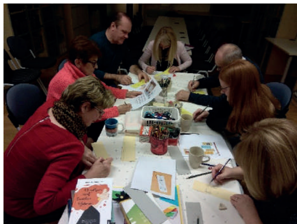
Slika 6. Susret članova Čitateljskog kluba „Knjiški moljac“ u siječnju 2020. uz izradu straničnika

U okviru nacionalne manifestacije Mjesec hrvatske knjige čitateljski klub posjetile su 16. listopada 2023. članice Čitateljskog kluba koji punih pet godina djeluje u okviru Kulturno-umjetničkog društva „Sveti Juraj na Bregu“ iz Međimurja. Nakon razgledavanja prostorija knjižnice održan je sastanak te rasprava o romanu Doživotna robija Vedrane Rudan koji je svojom tematikom o majčinstvu kao doživotnoj robiji otvorio brojna pitanja. Članovi Čitateljskog kluba „Knjiški moljac“ rado su razmijenili stečena čitateljska iskustva o brojnim knjigama koje su tijekom svog desetogodišnjeg djelovanja pročitali te prihvatili i brojne zanimljive prijedloge za nadolazeće zajedničke susrete.